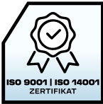
ISO 9001 Zertifikat des Qualitätsmanagementsystems nach ISO 9001 und ISO 14001