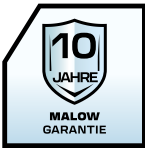
10 Jahre Garantie

Sul W ist eine Familie von Garderobenschränken mit zwei Fächern, die mit einem Einlegeboden, einer Inneneinteilung, Kleiderstange mit zwei Kleiderhaken, einem Selbstklebeschild und Lüftungsschlitzen für eine bessere Luftzirkulation ausgestattet sind. Die solide Konstruktion der Schränke ermöglicht die Aufstellung auf Beinen, einem Sockel, einem Untergestell mit Sitzfläche und Schuhablage sowie die Montage eines kleinen Daches. Die Sul Schränke werden in jedem Personalumkleideraum, Schulumkleideraum und Fitnessstudio verwendet. Die Möbel müssen nicht zusammengebaut werden., wodurch sie an Festigkeit und Stabilität gewinnen. Standardmäßig sind die Schränke ohne Aufpreis in 16 Farben erhältlich